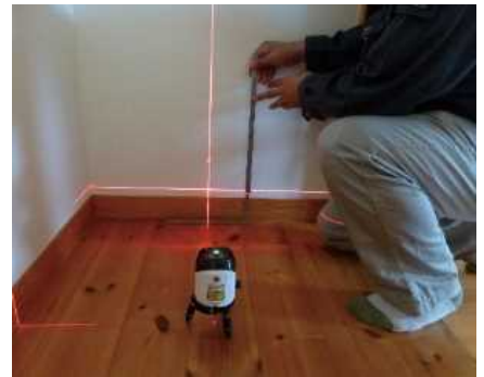
「床の傾きを計測する」調査機器